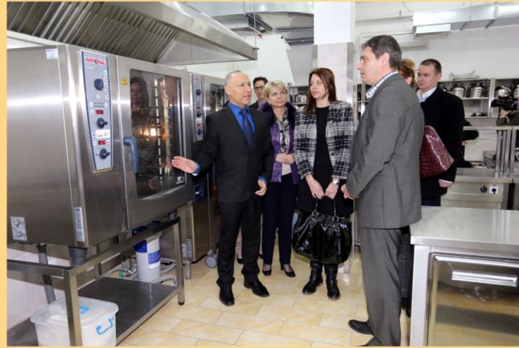
Kuhinja za 3000 mališana vrtića "Veseljko" u Obrenovcu poklon Izraelske ambasade u Beogradu i ambasadora Josefa Levija