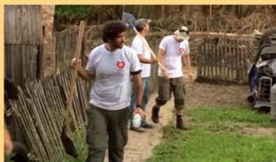
Volonteri LEV EHAD-a obučavaju srpske volontere za rad na terenu i pomažu u raščišćavanju