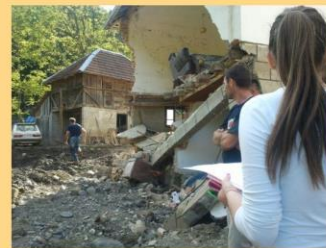
Volonteri LEV EHAD-a stižu u Krupanj