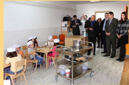
Prvi obroci u novoj kuhinji po receptima izraelskih kuvara