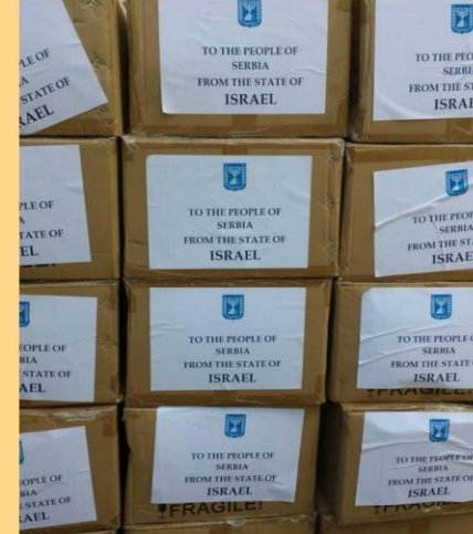
Pomoć stiže od Države Izrael i izraelskog naroda