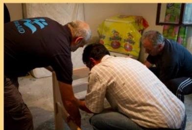
Prvo sagledavanje situacije, doprema pomoći i montaža kreveta