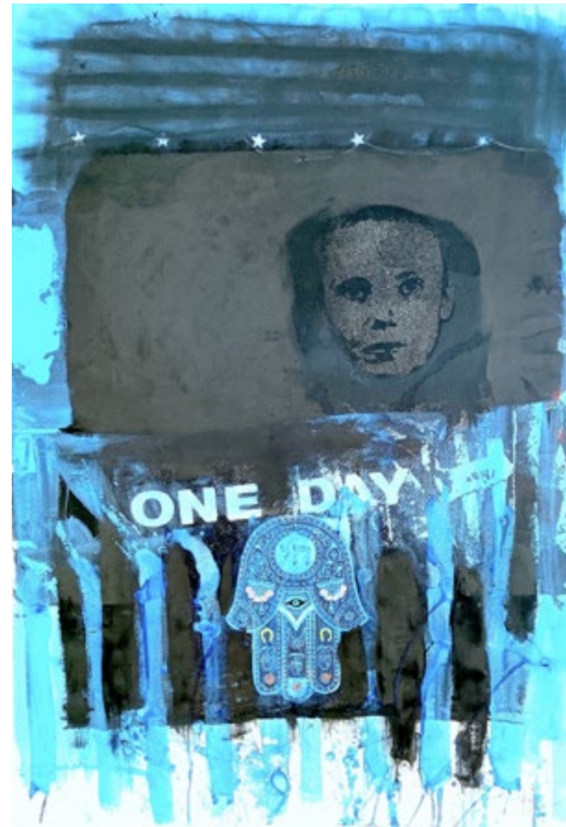
Plava tuga sito štampa 111 X 77 cm 2015