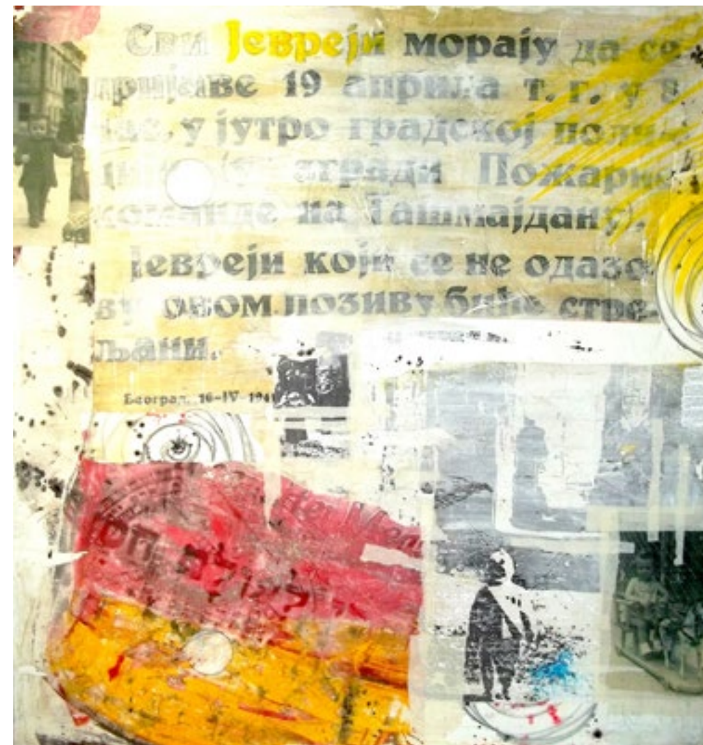
Sam sam digitalna grafika, 80 x 80 cm 2022