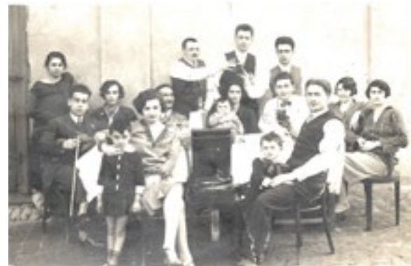
Rifkin gramofon-Dorćol, 1928.