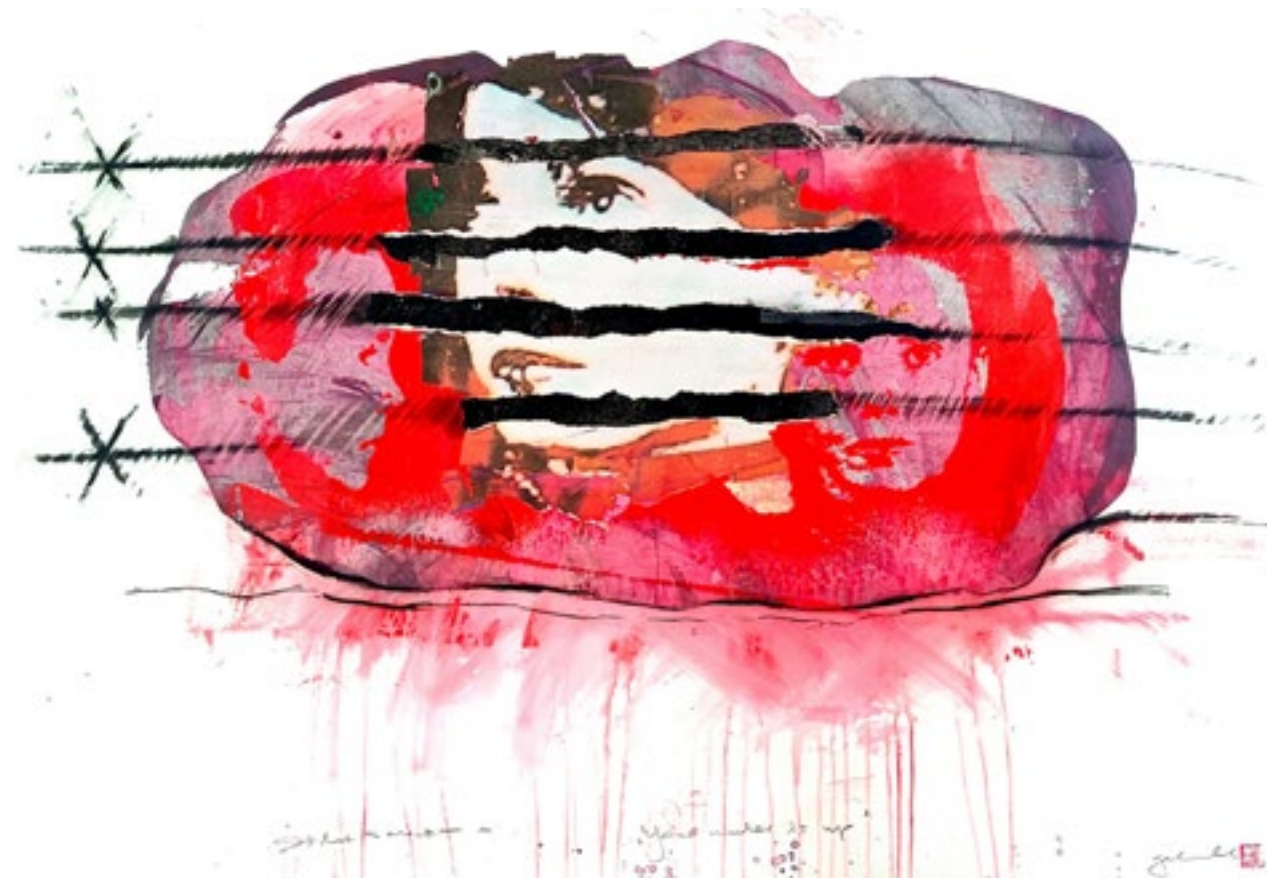
Izvučen je tvoj broj sito štampa sa ručnom manipulacijom 111 X 77 cm 2013