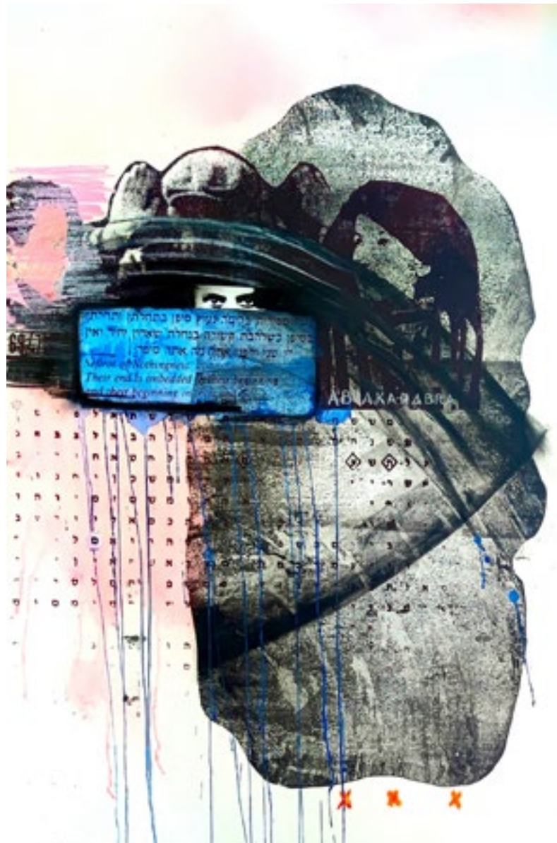
Spomenik sito štampa 108 X 77 cm 2006