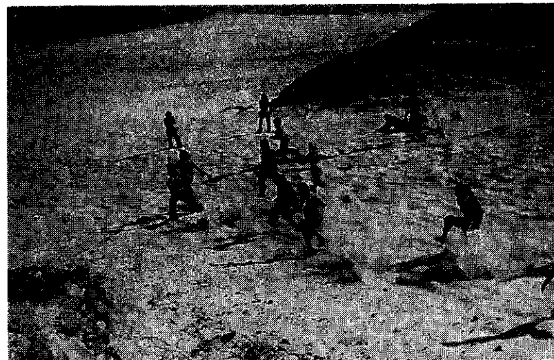
Učesnici seminara na trci za »Grand Prix« Crvenog Mora

parom. Nažalost, Mojsije nije mogao ovde da dovede plemena izraelska; gejzir su napravili Egipćani, pre nekoliko godina, u traganju za naftom. Predveče smo nastavili dalje i, već po mraku, stigli u Vadi Firan. (Vadi — arapska reč koja označava rečno korito, bilo ono sa vodom ili bez nje.) Ovaj vadi je najbogatiji rastinjem: ima oko 8000 palmi koje pripadaju beduinima koji ovde žive. Sada već sledimo put južne teorije eksodusa i sutra nas očekuje najuzbudljiviji trenutak — manastir Svete Katarine i Džabel Musa — legendarna Sinajska gora (jedna od mnogih, jer se ne zna tačno koje od brda je ono pravo). Saznanje da to možda i nije baš ona na kojoj je Mojsije dobio zapovesti nije nas ni malo uzbuđivalo; nije bitno mesto, bitni su zakoni!