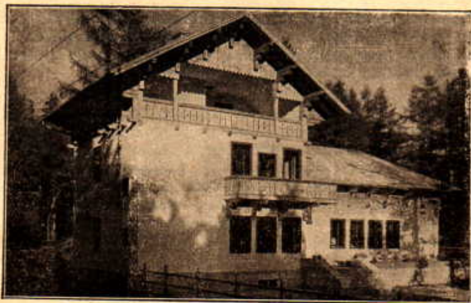
Dom Kralja Petra na Trebeviću

Sarajevo sa okolicom poznato je ne samo kao turistički centar, nego je u njemu i središte ribolovnog športa. Za razvitak ribolovnog športa već preko 30 godina vrlo blagotvorno djeluje Središnje ribarsko društvo u Sarajevu . To društvo pored državnih organa vodi stalno računa o zaštiti i podmlađivanju plemenitih vrsta riba u okolnim