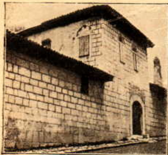
Синанова текија и гробље крај Синанове текије

Како се овога пута показало да непријатељска војска може доћи и до Сарајева и да мала тврђава не може свему народу послужити као збјег, буде одлучено да се тврђава знатно прошири.