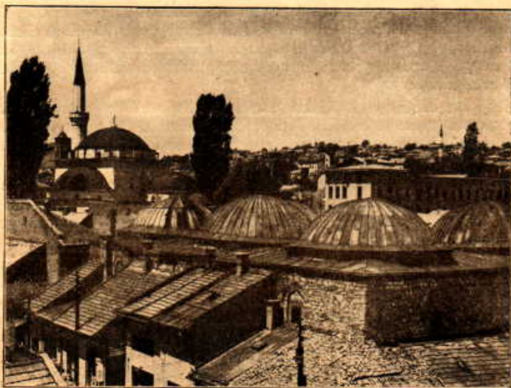
Бегова џамија, поглед са вијетнице