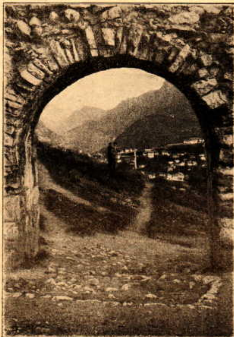
Улаз у град са источне стране

У 14 и 15 вијеку Врхбосна је била у власти моћних кнезова рогатичког Борча, кнезова Радјена Јабланића и сина му Павла, а после Павлова сина, великог војводе Радосава