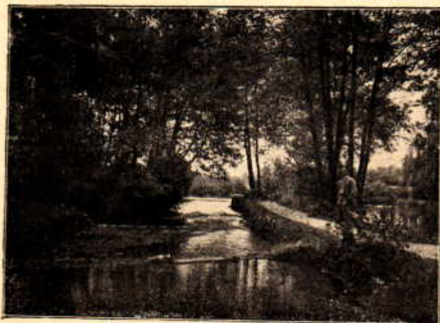
Vrelo Bosne kraj Sarajeva