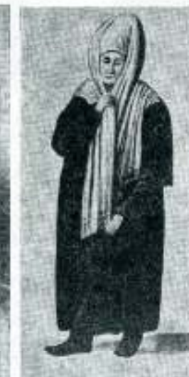
Turska jevrejka iz 18 veka.