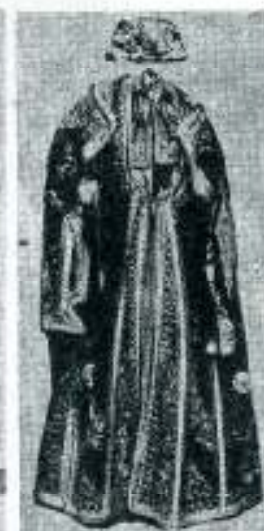
Sefardska nošnja iz 19. veka.