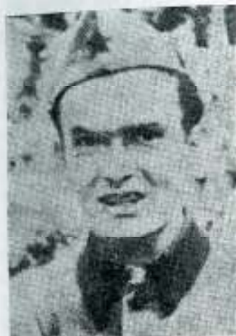
ENGEL Aleksandra ELIAS — — ILIJA ANDŽIĆ (1912 — 1944)

Rođen je 19. marta 1912. godine u Jajcu, Bosna i Hercegovina, u porodici intelektualaca.