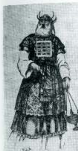
Visoki sveštenik iz Palestine, 500 god. p.n.e.