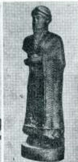
Sveštenik iz Sumera, 2000 god. p.n.e.