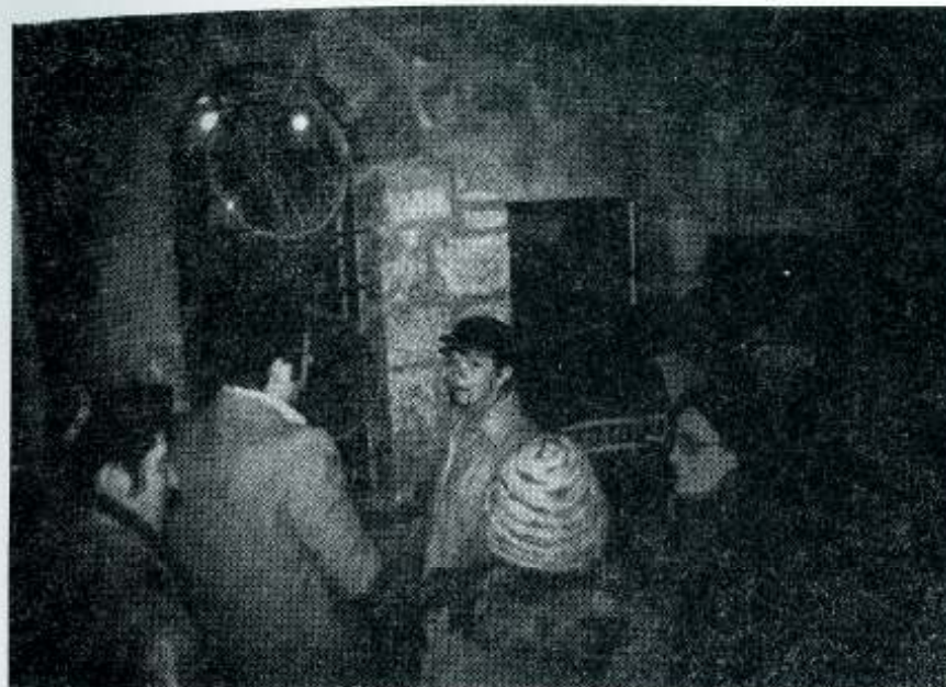
Posetioci ispred galerije