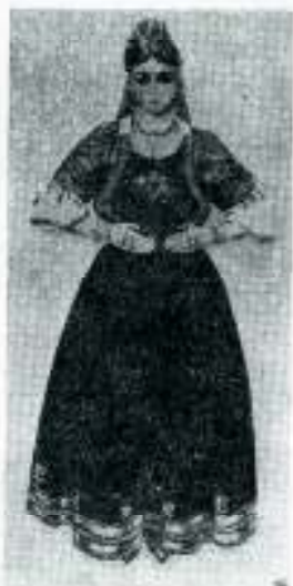
Udata Jevrejka iz Maroka, 1940. god.

Jevrejski zakoni protiv raskoši su samo delimično planirani da štite od ekstravagancije i razmetanja; njihov zadatak je takođe bio da spreče prihvatanje nove mode ili ono što je u hebrejskom bilo poznato kao šukat hagogim , gde pored zabrani nekih novina nalazimo sledeći citat kao ključ za jevrejski stav