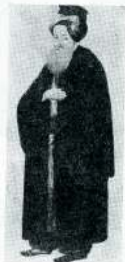
Turski Jevrej in s kraja 18 veka

po tom pitanju »Nemojte činiti što se čini u zemlji Misirskoj, u kojoj ste živjeli, niti činite što se čini u zemlji Hananskoj, u koju vas vodim, i po uredbama njihovijem nemojte živjeti.« (Treća knjiga Mojsijeva 18:3). To je osnova za mnogo širu zabranu sadržanu u Sulhan Aruh .