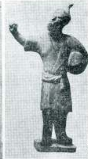
Jevrejski trgovac iz Kine; I vek.