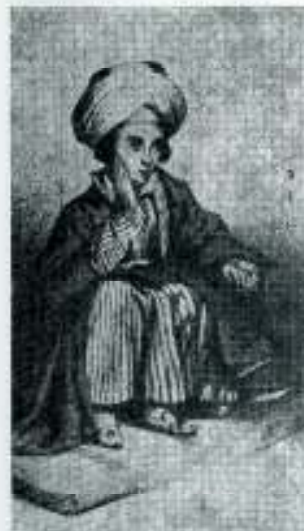
David, sin rabi Samuela, litografija iz 1850. god.