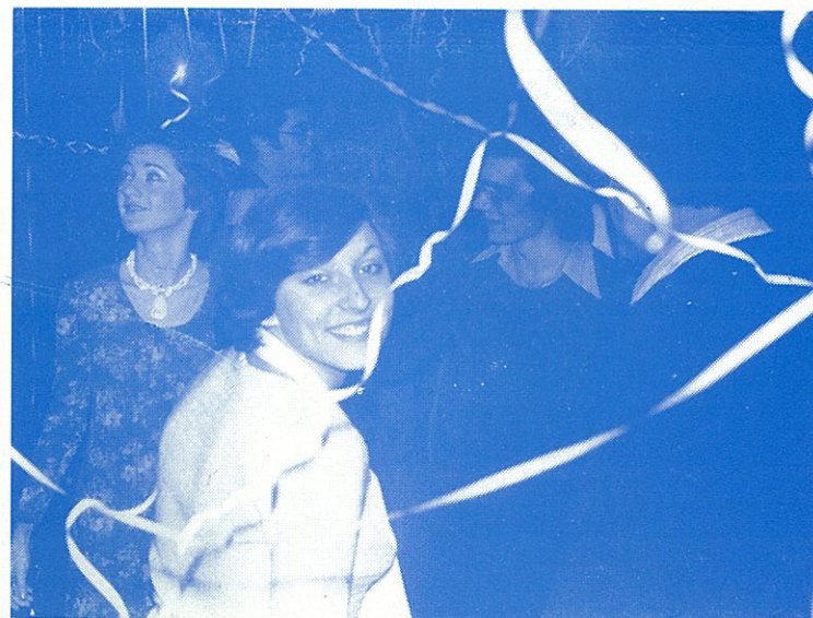
Sa dočeka Nove godine u Beogradskom klubu

»Za moje zdravlje,« reče Blum, »ništa nije suviše skupo!«