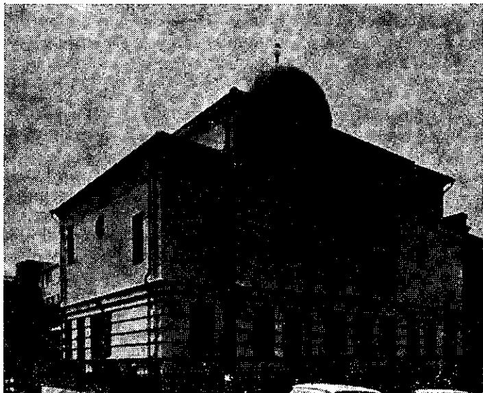
Sinagoga u Helsinkiju, sagrađena 1906.

vanja o svetskoj književnosti; i konačno, kao Jevrejinu, ovde mi je zabranjeno da se oženim, ali mi niko nije zabranio da se udvaram...» Međutim, svoja građanska prava Jevreji su u potpunosti ostvarili tek 1917. godine kada je Finska postala nezavisna.