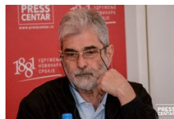
Preveo Brane Popović

Sve ovo je bila direktna posledica nemačke ratne agitacije. I zaista, kako su izbila neprijateljstva, Muftijina vriska „Ubijte Jevreje! Sve ih ubijte!“ mogla je jednako da dolazi i iz emisija za vreme rata. Sperl (Spoerl) je primetio: „Sukob koji je usledio bio je rat u samoodbrani, vođen protiv nemilosrdnog, pro-nacističkog i otvoreno genocidnog palestinskog rukovodstva, koje je uživalo ogromnu popularnost među arapskim i palestinskim masama.“ Ironija je da nisu cionisti bili oni koji su neginjali etničkom čišćenju i masovnoj kasapnici. To su bili Arapi. Pozornica je postavljena i spremno je čekala. Rat za nezavisnost je besneo, a za njim su u redu čekali Šestodnevni rat, pa Jomkipurski rat, sve veliki arapsko-izraelski sukobi, nesreće koje je džihadizam spremao za budućnost. Kao što Herf piše: „odbijanje Hamasa da prihvati rešenje sa dve države, Islamska republika Iran, al-Kaida, Hezbolah, PLO, sve je to delimično posledica jezive fuzije nacizma i islamizma tokom 1940-ih.“ Hitlerov duh je bio živ i delovao na udaljenim područjima.