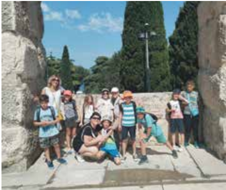
Dječji kamp Pula 2024.

Kamp ima svoje uspone i padove, ali zadovoljstvo je vidjeti djecu kako uživaju s prijateljima iz kampa. Tijekom posljednja tri ljeta vidjeli smo kako napreduju u samostalnosti i neovisnosti, kako razvijaju otpornost, društvene i međuljudske vještine.