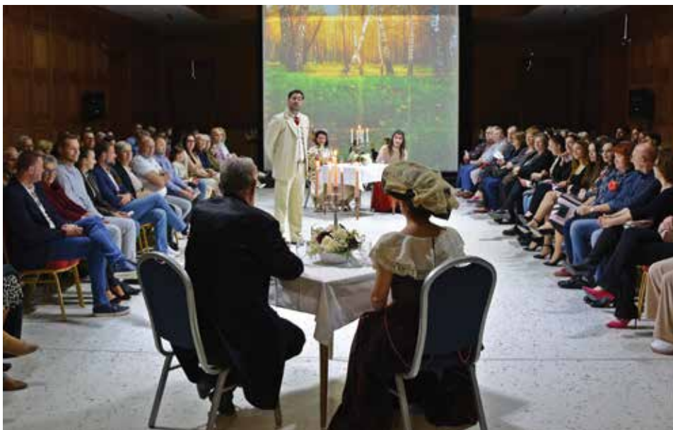
Detalji s predstave Palej ljubavi

U Belišću je 2. prosinca 2023. pretpremijerno, a dan kasnije i premijerno, izvedena fenomenalna, vrlo neobična i nesvakidašnja ambijentalna predstava, koja je nastala prema scenariju poznatog osječkog novinara i književnika Drage Hedla. Radi se o predstavi Palej ljubavi redatelja Mladena Merzela, koja je nastala u suradnji Grada Belišće, Turističke zajednice grada Belišće, belišćanskog Centra za kulturu Sigmund Romberg i Hrvatskog narodnog kazališta u Osijeku. Predstava je nakon toga izvedena ponovo 27. travnja 2024. Sva tri puta igrana je u prepunom predvorju Palače Gutmann, poznatoj kao Palej .