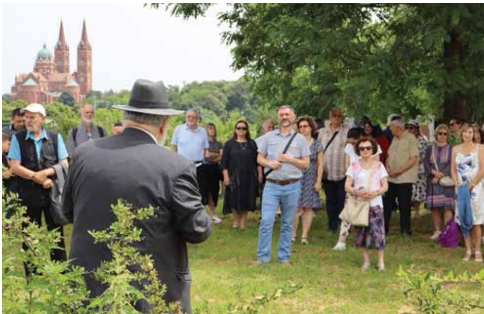
Kadiš na đakovačkom groblju

U nedjelju 9. lipnja bilo je vruće ljetno prijepodne, ali hlad stoljetnih lipa na đakovačkom židovskom groblju pružio je dobrodošlicu brojnim posjetiteljima. Razlog okupljanja tužni su događaji iz 1943. godine – tada je u ustaškom sabirnom logoru, u pitomom slavonskom gradiću Đakovo, stradalo oko 600 žena i djece.