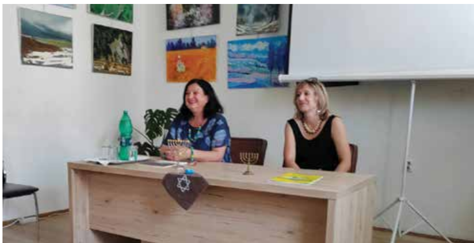
U prostorijama osječkog pododbora SKD Prosvjeta