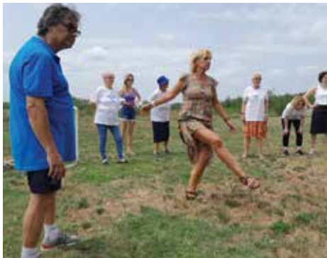
Natjecanje u ženskoj kategoriji