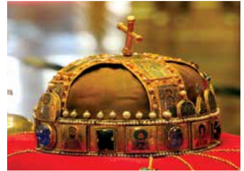
Kruna sv. Stjepana

Bježeći pred boljševičkom vojskom nacisti i Strelasti križevi opljačkali su mnogo toga važnoga za Mađarsku. Demontirali su i odnijeli postrojenja iz mnogih tvornica, medicinsku opremu i lijekove te druge zalihe iz bolnica, umjetničku i kulturnu baštinu iz mnogih crkava, sinagoga, samostana, muzejskih