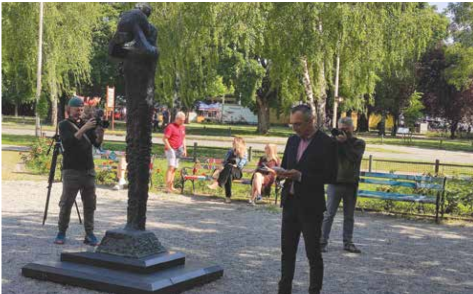
Komemoracija za Jom Hašoa u osječkom Parku Oskara Nemona