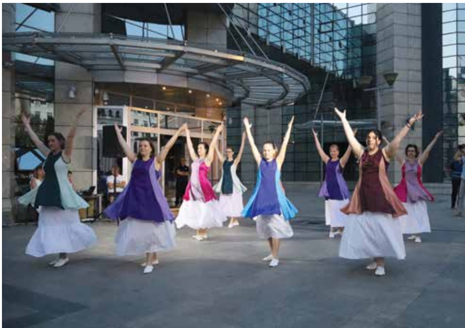
S nastupa u Skopju

je poput razbijene glave (posljedica pada u kadi) ili neviđeno nažuljanih, izranjavanih nogu, koje su bile prepune žuljeva već i prije nastupa, a pogotovo nakon njega. Tako da pojedinim plesačicama zaista nije bilo lako da vesele i nasmijane nastupe na plesnom podiju. No, kada su se svjetla pozornice upalila, jedino na što smo mislile bio je ples; kako što bolje predstaviti svoju grupu, svoju židovsku općinu, svoj grad i židovsku kulturu. Jesmo li u tome uspjele, morat ćete pitati gledatelje.