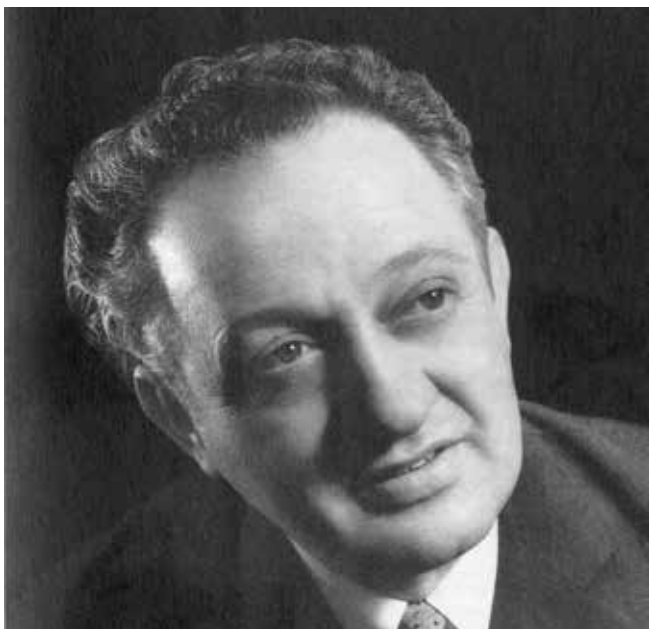
Frano Krčić u mladim danima

Dvadeset četiri godine prošlo je od smrti Frane Krčića, najstarijega i najdugotrajnijega osječkoga glumca, dugogodišnjega prvaka Drame HNK-a u Osijeku. Glumac koji je od 1958., s iznimkom dvije godine rada u mostarskom kazalištu, više od četrdesetljeća umjetničkoga angažmana posvetio voljenom Osijeku, umro je kada mu je bilo 80 godina.