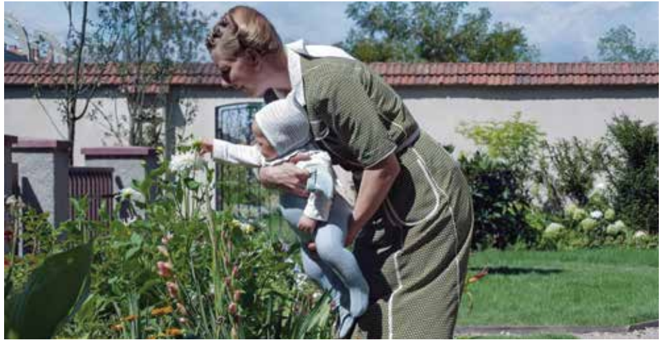
Iz filma Zona interesa

Zanimljivo je promatrati, kroz prizmu banalnosti zla , sličnosti i razlike između Adolfa Eichmanna i Rudolfa Hössa. Zajedničko im je dugogodišnje članstvo u nacističkoj stranci i aktivno sudjelovanje u formacijama SS. Odmah se može vidjeti (barem iz onog što se može pronaći u dostupnoj literaturi i sudskim dokumentima) da su obojica revno provodili zadatke i ciljeve nacista (fizička likvidacija svih Židova na tlu Europe). No od samog početka rata mogla se uočiti i razlika – Eichmann se isticao u organizacionim pitanjima oko provedbe Holokausta (hvatanju i deportiranju Židova u početku do skrivenih mjesta egzekucije, a kasnije u koncentracijske logore, posebice Auschwitz), dok je Rudolf Höss u procesu „konačnog rješenja židovskog pitanja“ bio konačna, tragična faza (istrebljenje). Eichmann nije volio gledati proljevanje ljudske krvi, strijeljanje, zatrpavanje posmrtnih ostataka u masovne grobnice. Zato je upravo začuđujuće da ga je Hit-