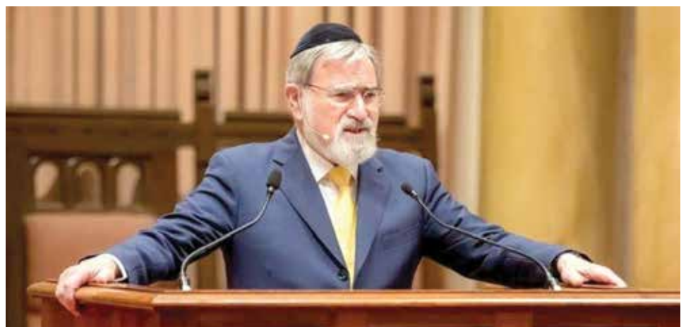
Fotografija rabina Jonathana Sacksa preuzeta s portala Irish Independent

Danas sam probao dati glas onima koji ga nemaju. Govorio sam u ime ubijenih Roma, Sintija, homoseksualaca, disidenata, mentalno i fizički hendikepiranih, i u ime milion i pol židovske djece ubijenih zbog religije njihovih djedova. U njihovo ime, govorim vam: „Znate gdje put vodi. Ne idite ponovo tim putem. Vi ste vođe Europe. Njena je budućnost u vašim rukama. Ako ništa ne učinite, Židovi će otići, europska će sloboda umrijeti i ostat će moralna ljaga na imenu Europe koju cijela vječnost neće obrisati. Zaustavite to dok još ima vremena. Hvala vam!“