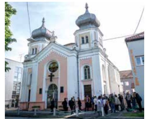
Osječka Donjogradska sinagoga