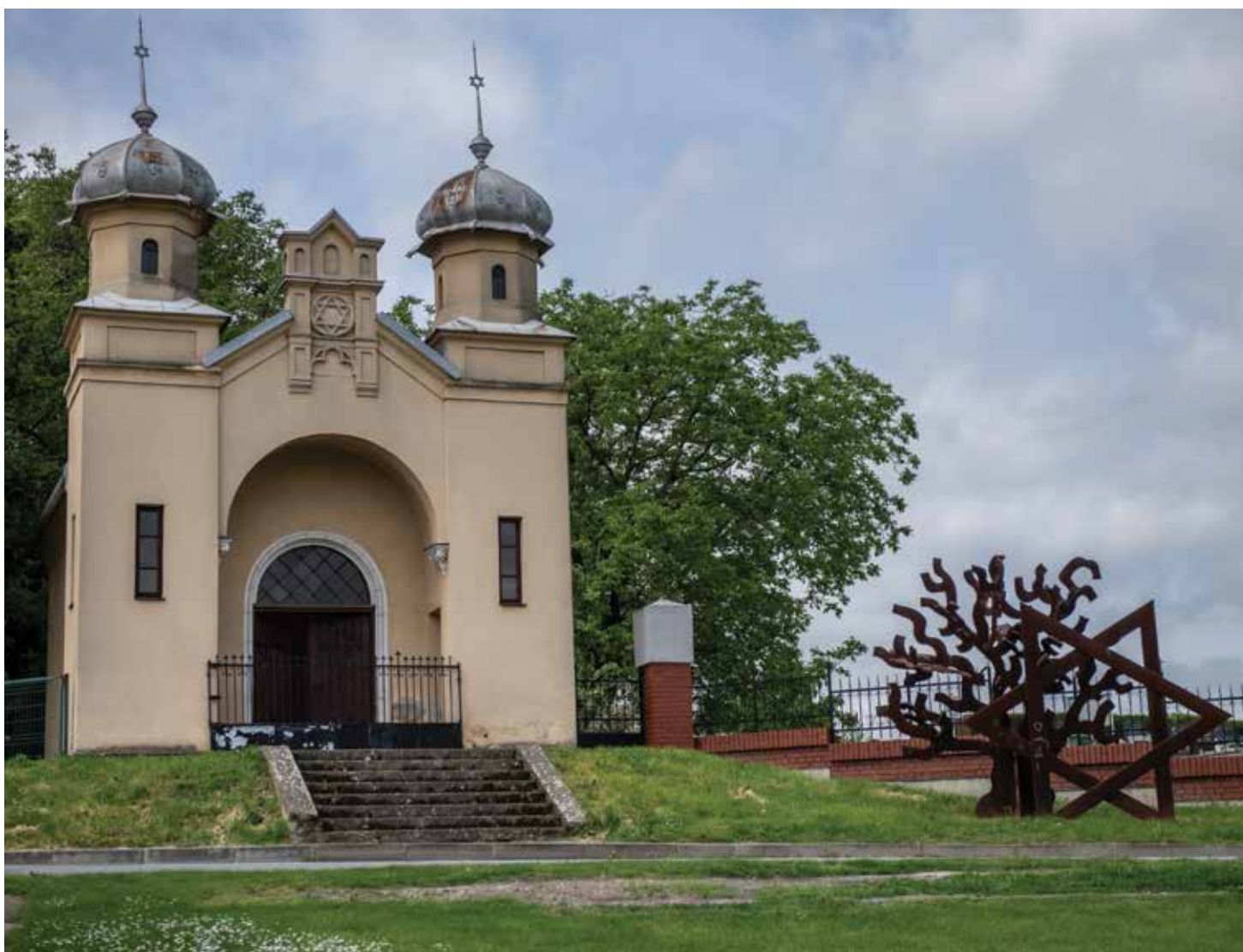
Prostor ispred đakovačkog židovskog groblja