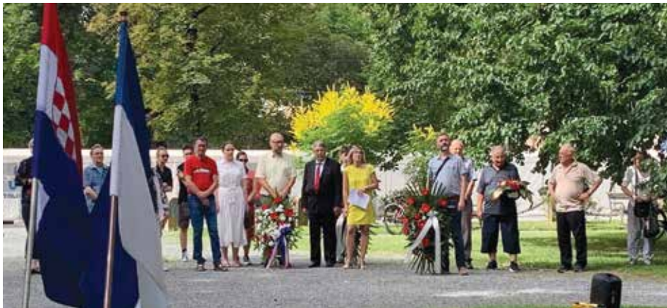
Polaganje vijenaca u Perivoju kralja Tomislava

Udruga antifašističkih boraca i antifašista Osijeka pozvala nas na obilježavanje Dana antifašističke borbe u Republici Hrvatskoj. Članovi Židovske općine Osijek odazvali su se obilježavanju i svojim prisustvom uveličali ovaj značajan državni praznik.