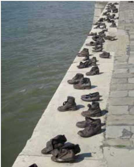
Spomen-obilježje Cipele na obali Dunava

Krajem 1944. godine i tijekom siječnja 1945. milicija Strelastih križeva vršila je stravične zločine u središtu Budimpešte, na obali Dunava. Ubijani su Židovi, Romi i njihovi ideološki i politički protivnici. Krvnici su mrtva tijela žrtava bacali u hladne i brze vode Dunava ili u rupe u ledu zaleđenog Dunava.