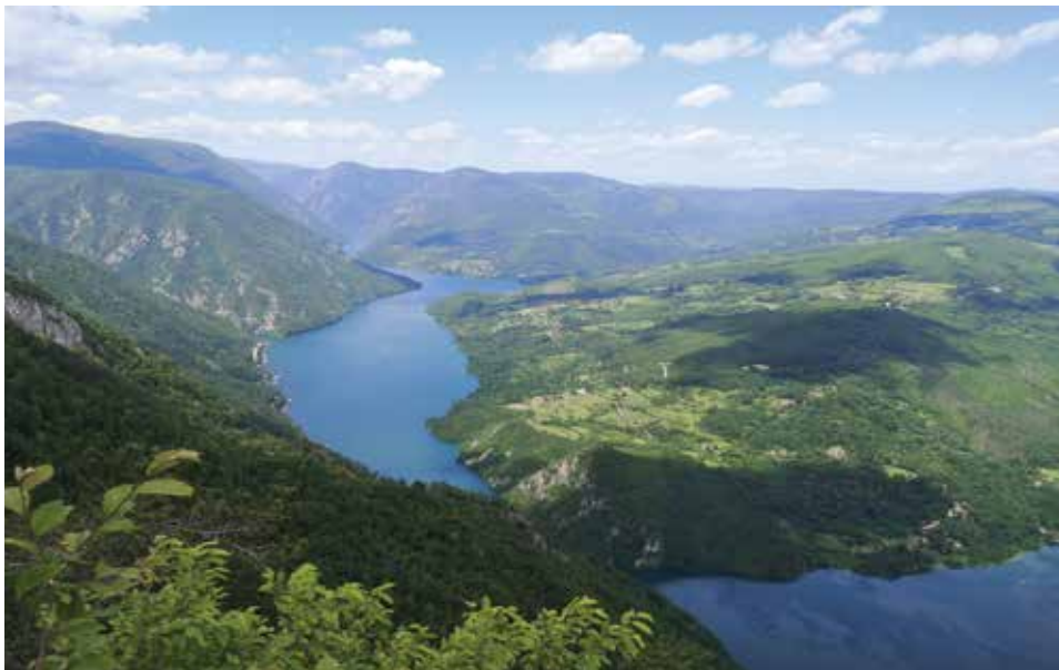
Pogled s vidikovca Banjska stena

Obiteljski seminar, koji tradicionalno organizira JO Beograd, ove je godine bio po mnogočemu drugačiji nego inače, no čini mi se da je sudionike najviše iznenadila promjena termina i mjesta održavanja. Naime, seminar se obično odvijao za vrijeme prvomajskih praznika, dok je ove godine bio mjesec dana kasnije; također, obično se održavao u hotelu Đerdap u Kladovu, dok je ove godine bio u hotelu Omorika na planini Tara.