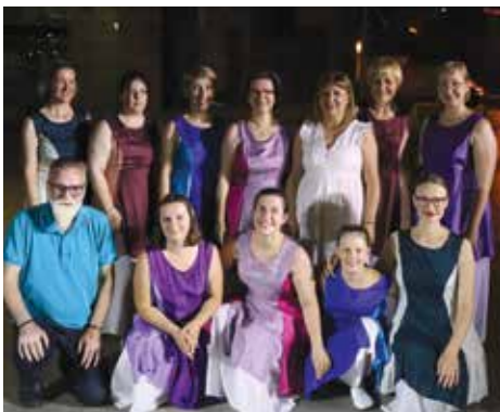
Plesačice s organizatorima

Plesna skupina Haverim Shell Israel nedavno se vratila s gostovanja u Makedoniji. Tijekom svog trodnevnog boravka u Skoplju, plesačice su, u sklopu Skopskog kulturnog leta, u subotu 29. lipnja nastupile na platou ispred Memorijalnog centra Holokausta Židova Makedonije predstavljajući mnogobrojnoj skopljanskoj publici bogatstvo izraelskog i židovskog plesa.