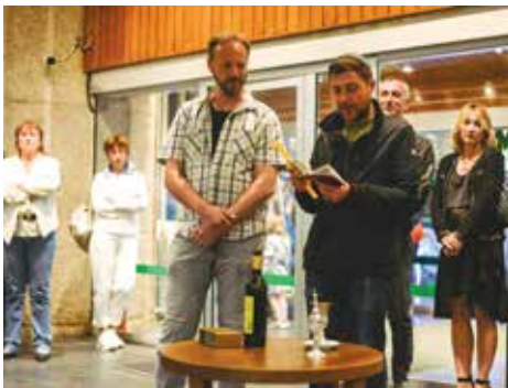
Iz programa za odrasle