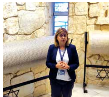
Memorijalni centar Holokausta prizemlje