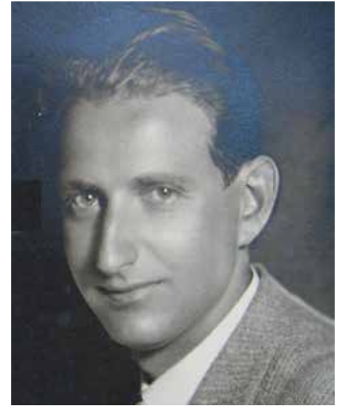
Alfred Fischer iz 1933. godine

Raoul Wallenberg nije izgubio svoj život od nacističke, nego od oslobodilačke, crvenoarmijske ruke; to je sve do danas obavijeno velom tajne.