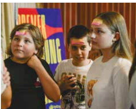
Iz programa za djecu