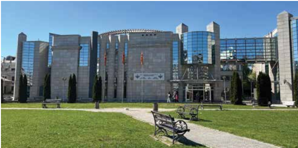
Memorijalni centar izvana