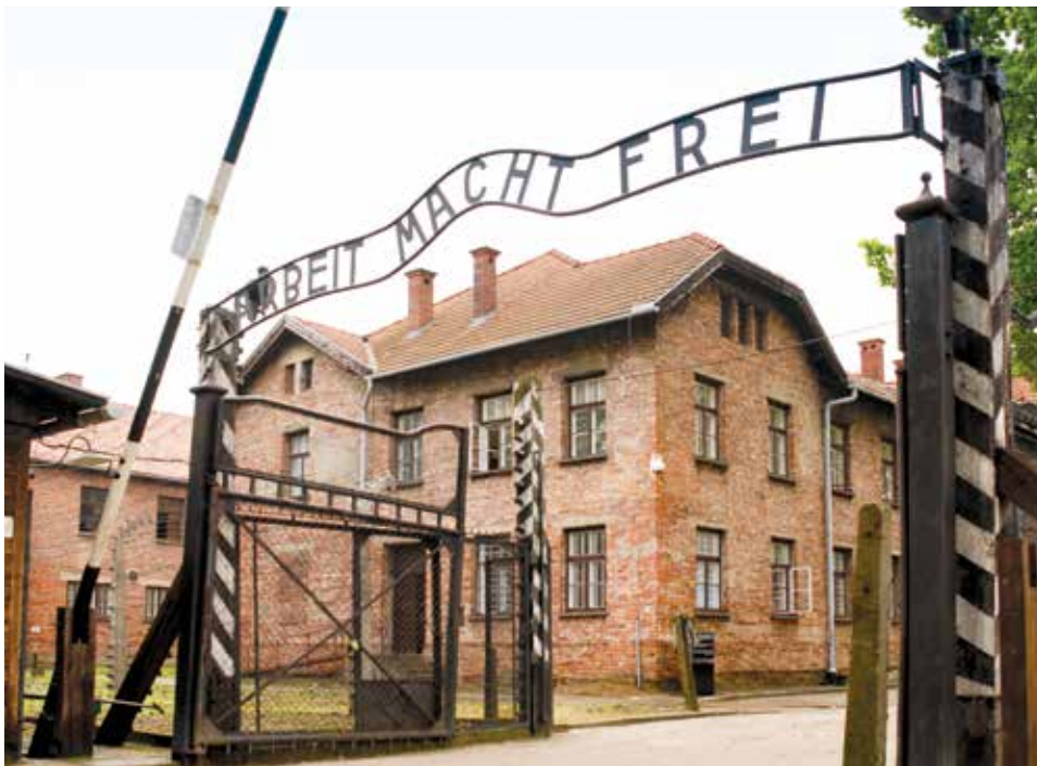
Ulaz u logor Auschwitz

nika, lavež stražarskih pasa, zvuk dolazećih vlakova s deportiranim Židovima. Zvukovi na trenutke izazivaju jezu. Zona interesa je jedini film u kojem su nacisti prikazani kao obične osobe; kupaju se na rijeci s obitelji, igraju se s djecom, čitaju im pripovjetke prije spavanja, sade cvijeće i povrće, trude se idilično živjeti. Međutim, ne vidimo ono što se zbiva s unutrašnje strane zida. Tamo je na okrutne načine ubijeno oko 1.3 milijuna ljudskih bića. Horor je ovdje sveden na zvučnu kulisu, što u ranijim filmovima nismo doživjeli.