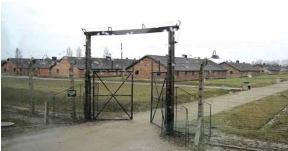
Ulaz u logor Birkenau

Završetak „karijere“ Eichmanna i Hössa također ima sličnosti, ali i bitnih razlika. Obojica su koncem 1944. godine, nekoliko mjeseci prije kraja Drugog svjetskog rata, nestali, kao da su u zemlju propali. Štitila ih je dobro organizirana mreža nacističkih jataka. Obojica su se skrivala pod raznim imenima i na mjestima gdje su vjerovali da su najmanje izloženi savezničkim organima gonjenja. Nacistička vojna i politička vrhuška bila je gotovo kompletno uhvaćena i suđena u Nürnbergu. Ova dvojica najrevnijih izvršitelja genocida nad Židovima izbjegla su Nürnberg, ali su ipak došli pred lice pravde.