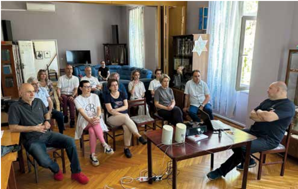
Sa seminara za odrasle

18. svibnja u prostorijama Židovske općine u Osijeku održana je zanimljiva i edukativna radionica pod nazivom EUCARE community awareness – trening za zajednicu.